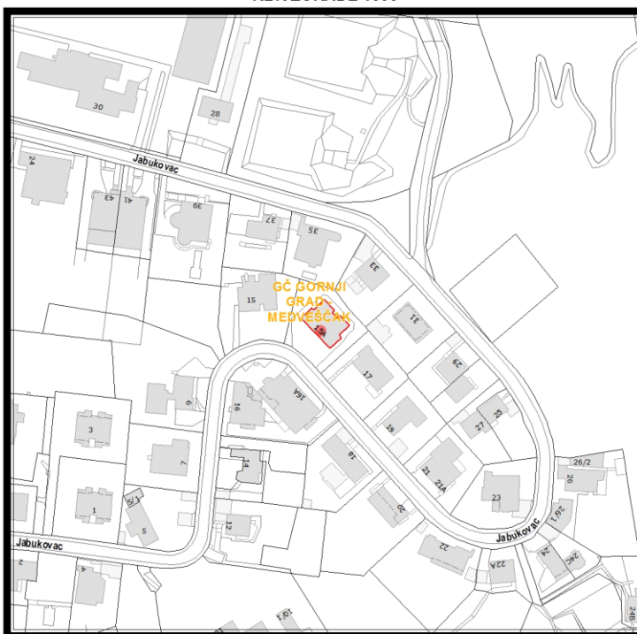
RBR ZGRADE 1333

Građevinsko stanje uličnog pročelja: mjestimično oštećeno, oštećeno je manje od 50% površine.