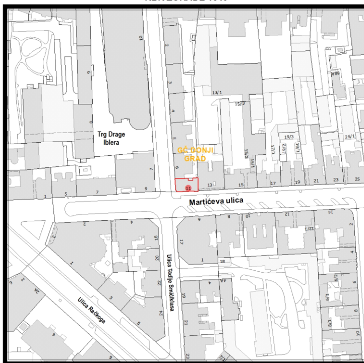
RBR ZGRADE 1349

Građevinsko stanje uličnog pročelja: mjestimično oštećeno, oštećeno je manje od 50% površine.