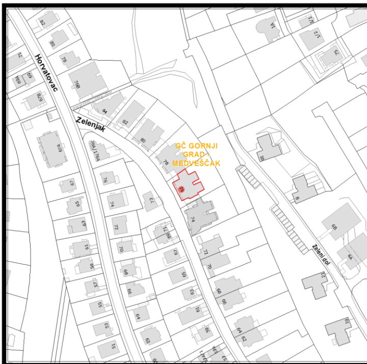
RBR ZGRADE 1629

Građevinsko stanje uličnog pročelja: zadovoljavajuće.