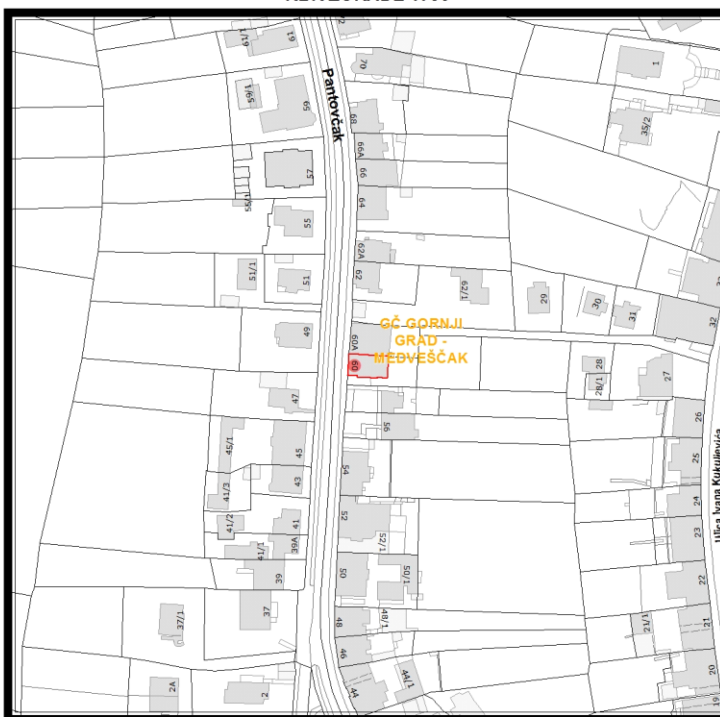
RBR ZGRADE 1753

Građevinsko stanje uličnog pročelja: mjestimično oštećeno, oštećeno je manje od 50% površine.