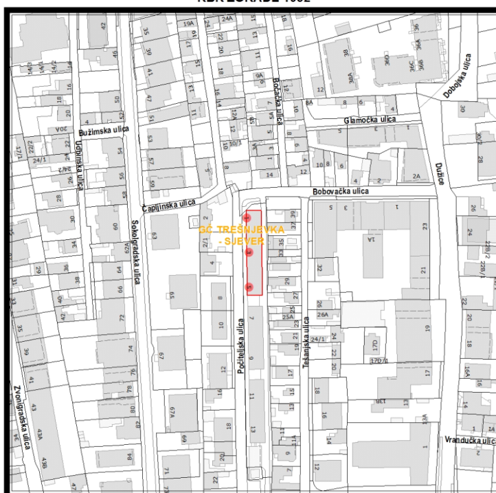
RBR ZGRADE 1952

Građevinsko stanje uličnog pročelja: mjestimično oštećeno, oštećeno je manje od 50% površine.