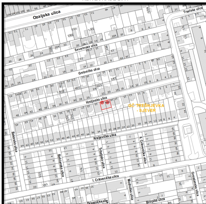
RBR ZGRADE 2011

Građevinsko stanje uličnog pročelja: mjestimično oštećeno, oštećeno je manje od 50% površine.