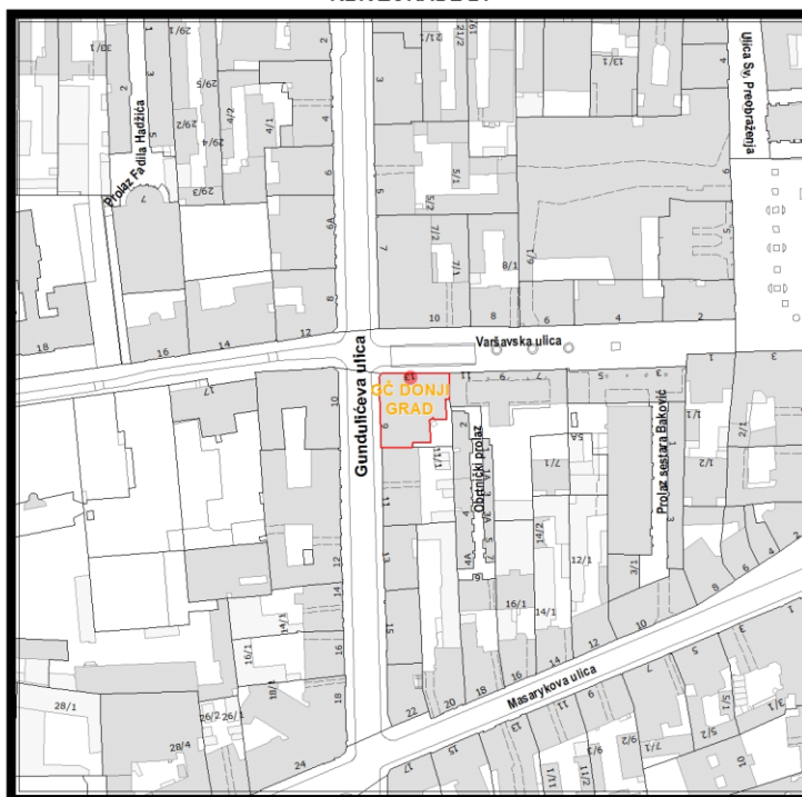
RBR ZGRADE 21

Građevinsko stanje uličnog pročelja: mjestimično oštećeno, oštećeno je manje od 50% površine.