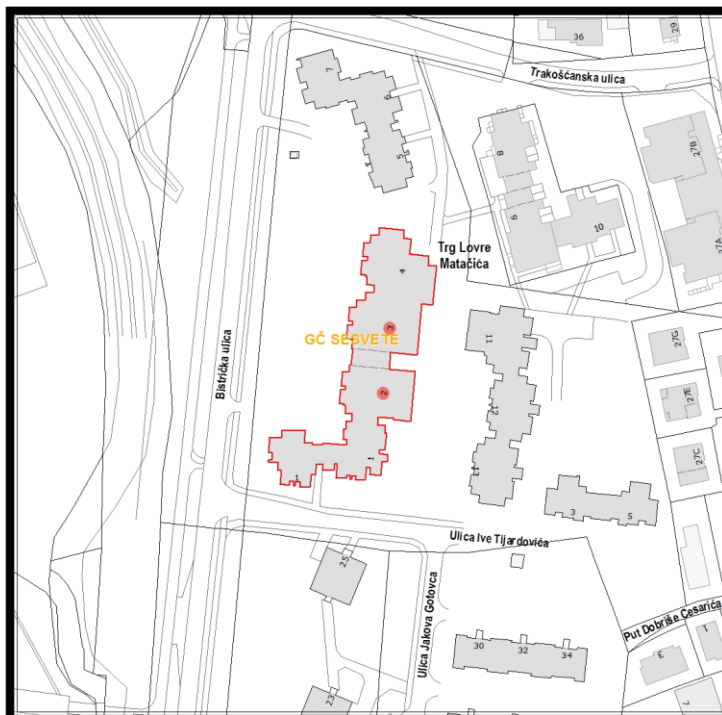
RBR ZGRADE 2321

Građevinsko stanje uličnog pročelja: mjestimično oštećeno, oštećeno je manje od 50% površine.