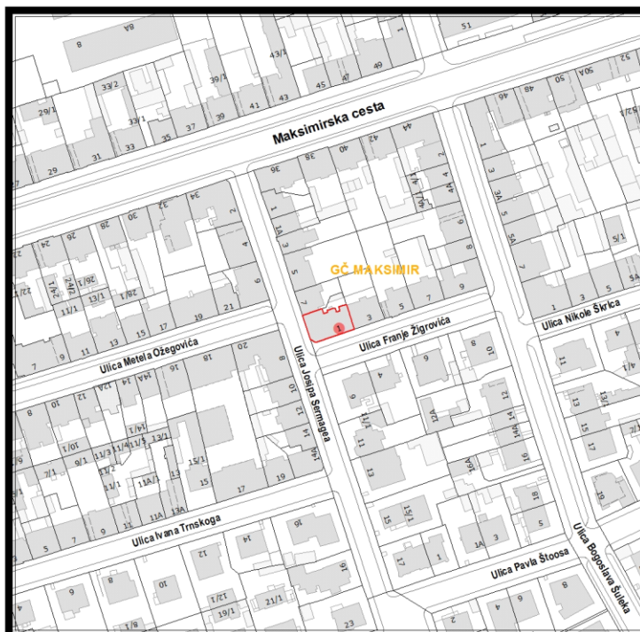
RBR ZGRADE 2460

Građevinsko stanje uličnog pročelja: oštećeno je 50% i više od 50 % površine.