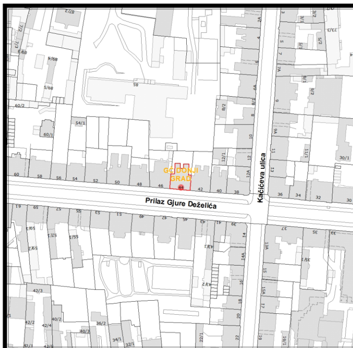
RBR ZGRADE 2556

Građevinsko stanje uličnog pročelja: mjestimično oštećeno, oštećeno je manje od 50% površine.