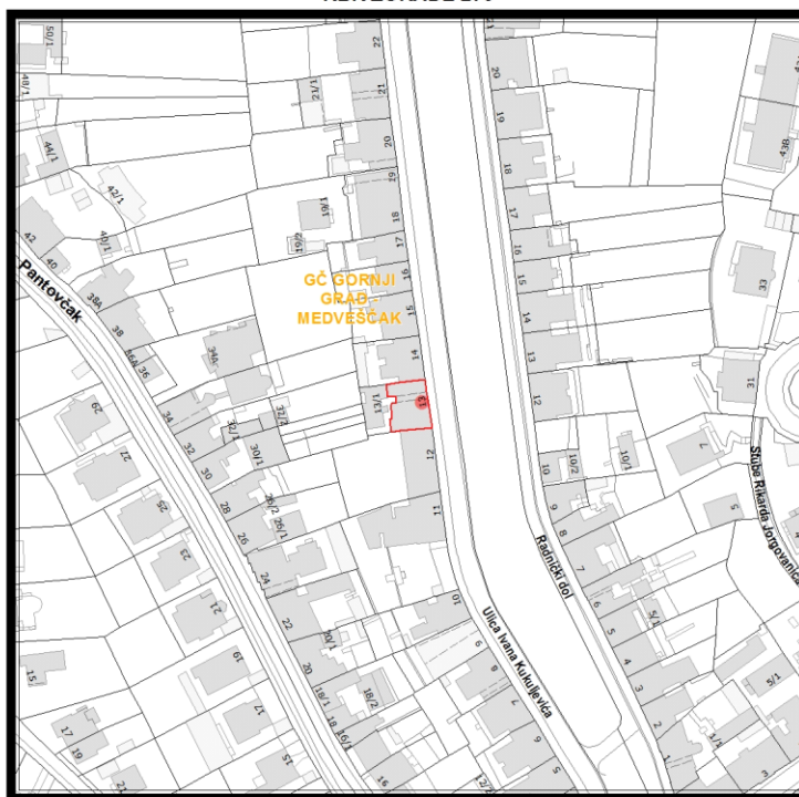
RBR ZGRADE 270

Građevinsko stanje uličnog pročelja: oštećeno je 50% i više od 50 % površine.