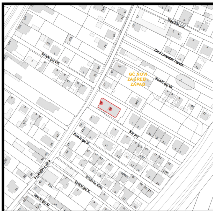
RBR ZGRADE 3013

Građevinsko stanje uličnog pročelja: zadovoljavajuće.