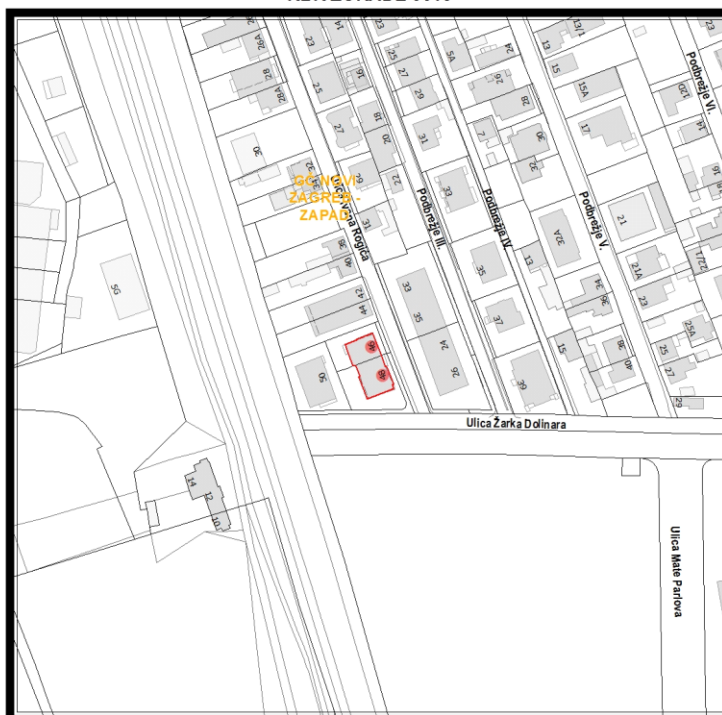
RBR ZGRADE 3015

Građevinsko stanje uličnog pročelja: zadovoljavajuće.