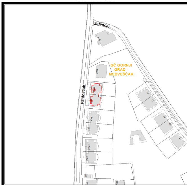
RBR ZGRADE 3063

Građevinsko stanje uličnog pročelja: zadovoljavajuće.