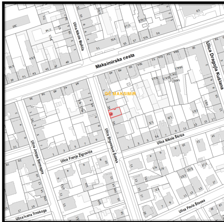
RBR ZGRADE 648

Građevinsko stanje uličnog pročelja: oštećeno je 50% i više od 50 % površine.