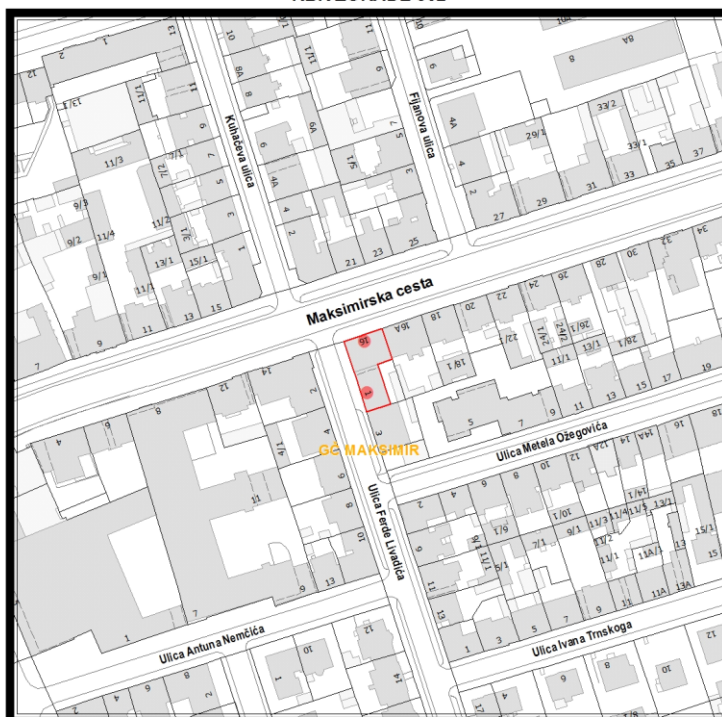
RBR ZGRADE 802

Građevinsko stanje uličnog pročelja: mjestimično oštećeno, oštećeno je manje od 50% površine.