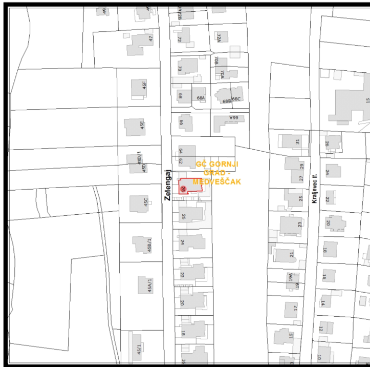
RBR ZGRADE 824

Građevinsko stanje uličnog pročelja: zadovoljavajuće.