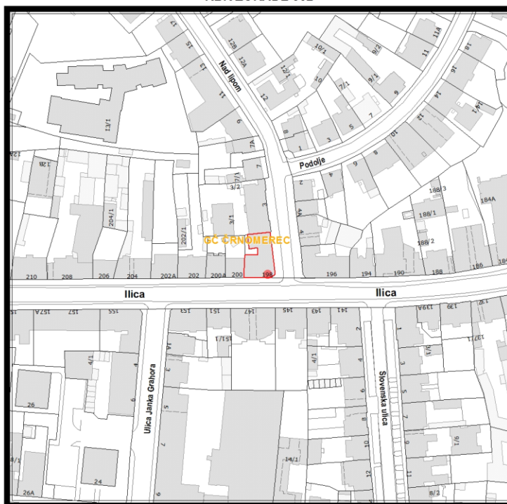
RBR ZGRADE 852

Građevinsko stanje uličnog pročelja: mjestimično oštećeno, oštećeno je manje od 50% površine.