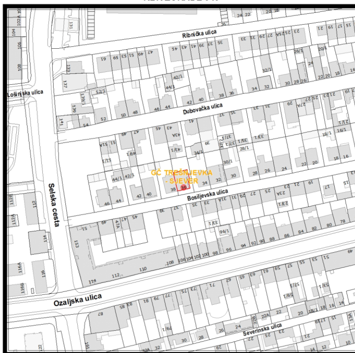
RBR ZGRADE 949

Građevinsko stanje uličnog pročelja: mjestimično oštećeno, oštećeno je manje od 50% površine.