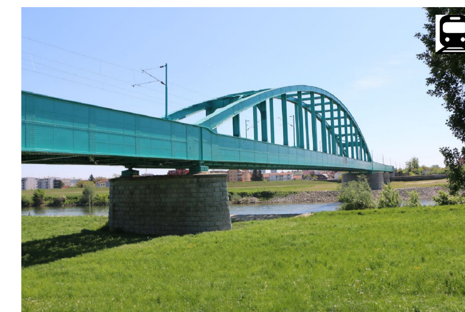
6. ŽELJEZNIČKI (ZELENI/HENDRIXOV) MOST, 1939.