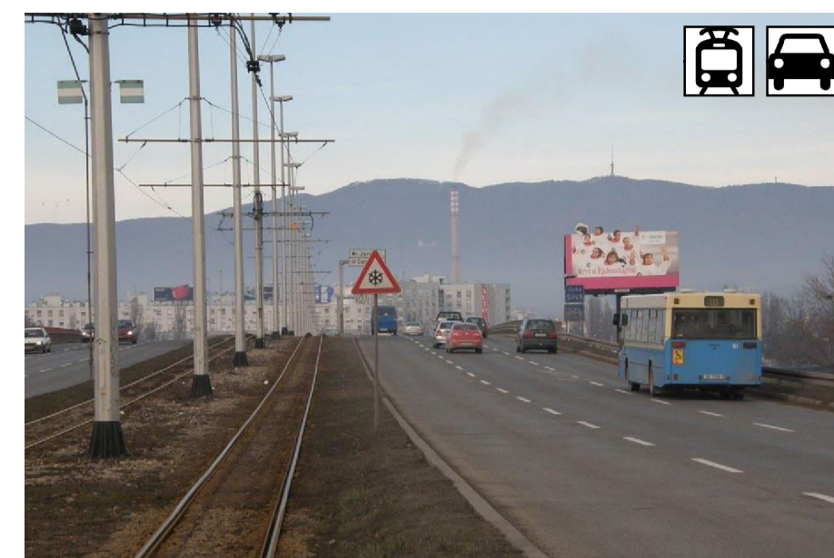
4. JADRANSKI MOST, 1981., projektant Zvonimir Lončarić