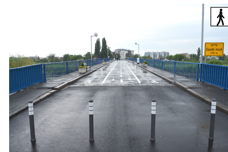
5. STARI SAVSKI MOST, 1938., projektant Milivoj Frković