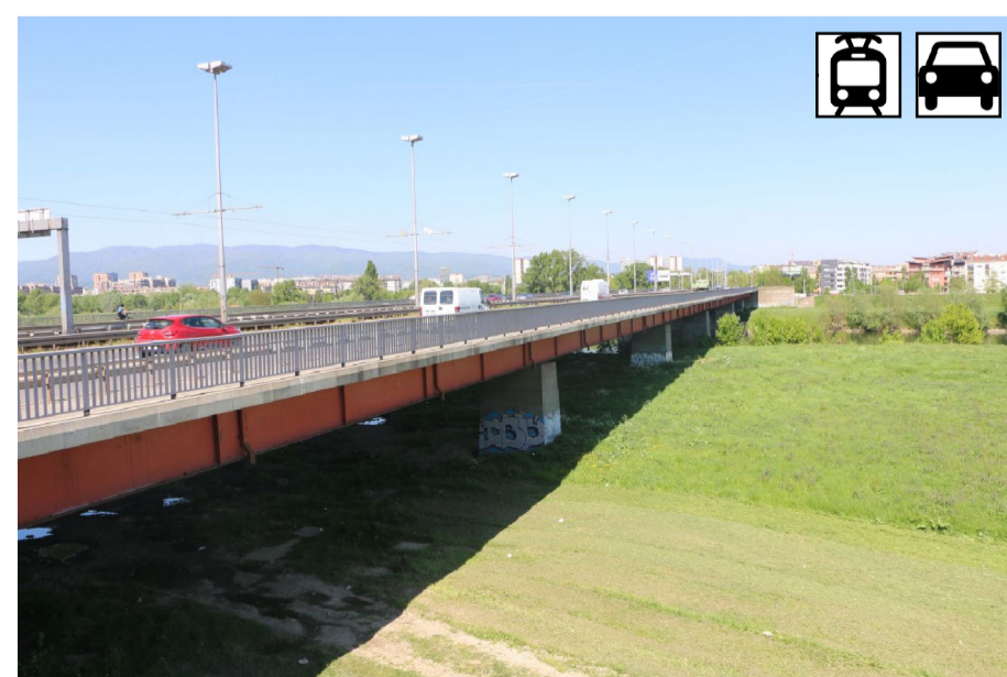
8. MOST MLADOSTI, 1974., projektant Vojislav Draganić