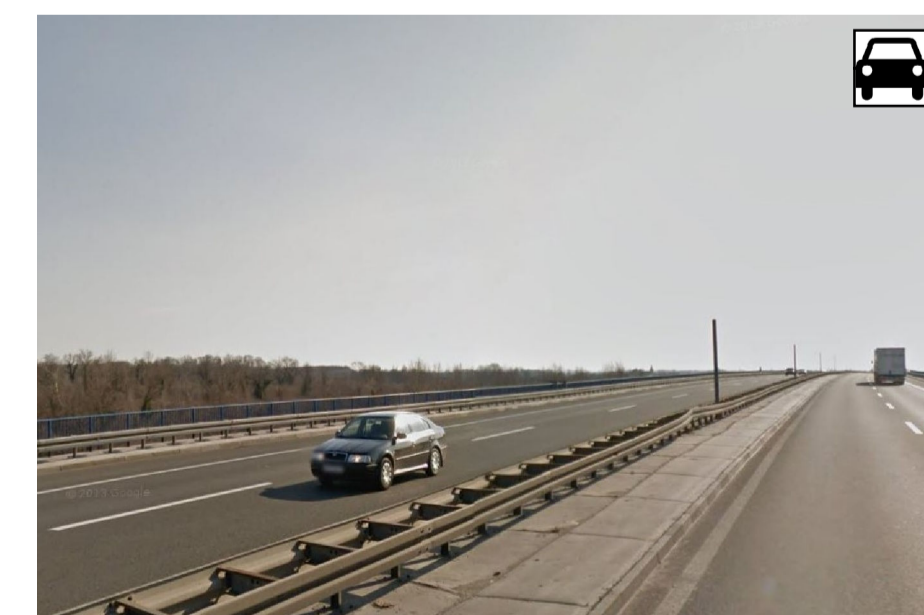
11. MOST SAVA - IVANJA REKA, 1981., projektant Zvonimir Lončarić