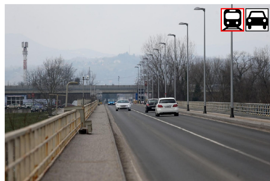
2. PODSUŠEDSKI MOST, 1982., projektant Vojislav Draganić