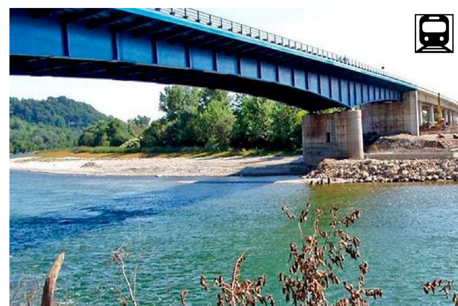
1. MOST ZAPREŠIĆ, 1980., projektant Josip Novak