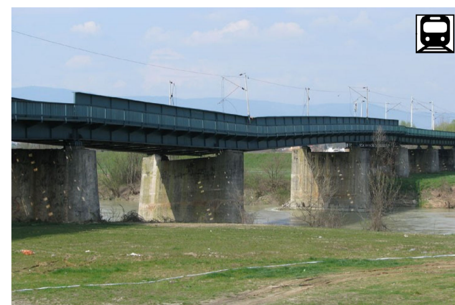
9. ŽELJEZNIČKI MOST, MIČEVEC, 1968., projektant Ljubomir Jevtović