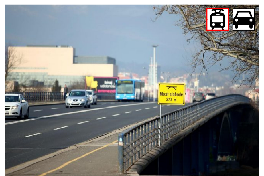
7. MOST SLOBODE, 1959., projektant Krunoslav Tonković