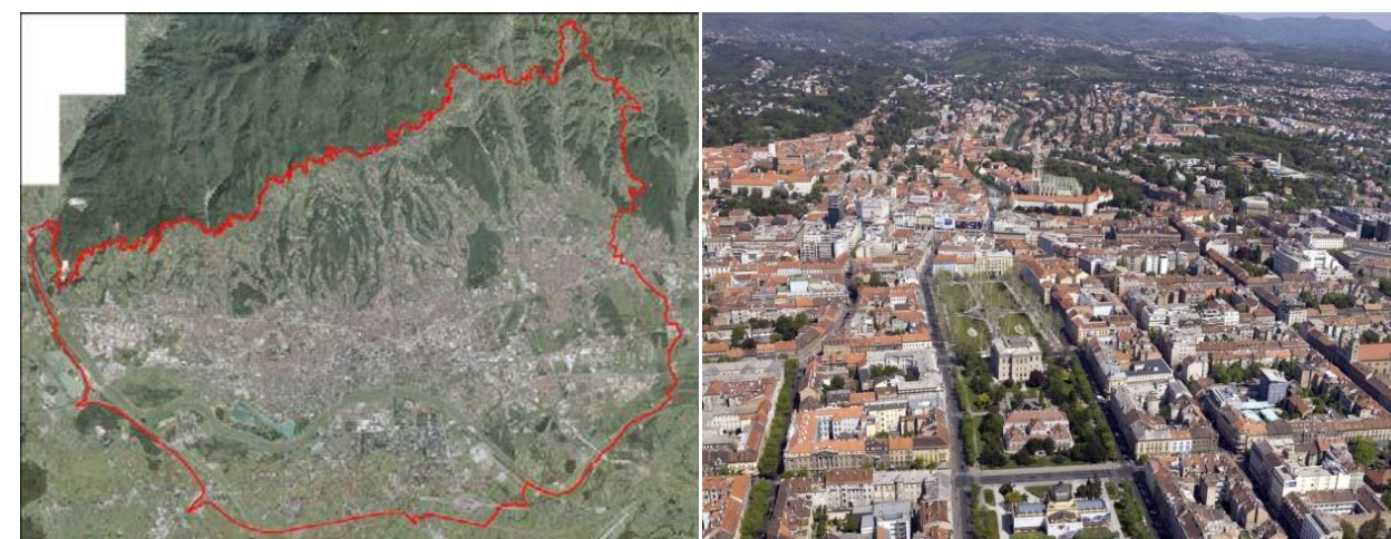
područje obuhvata Generalnog urbanističkog plana grada

Izrada izmjena i dopuna GUP-a grada Zagreba (u daljnjem tekstu Plan) pokrenuta je Odlukom o izradi Izmjena i dopuna Generalnoga urbanističkog plana grada Zagreba (Službeni glasnik Grada Zagreba 24/13, 8/15 i 15/15). Obuhvat Izmjena i dopuna istovjetan je prostoru Generalnoga urbanističkog plana grada Zagreba koji je određen Prostornim planom Grada Zagreba, a obuhvaća uže područje grada Zagreba, između Parka prirode Medvednica i zagrebačke obilaznice, površine oko 220 km 2 .