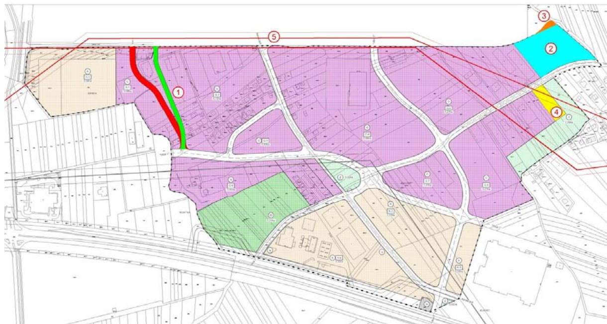
grafički prikaz planiranih izmjena