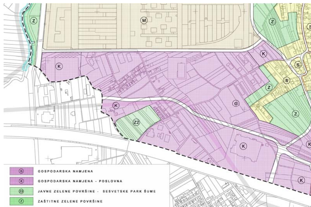
GUP Sesveta (Službeni glasnik Grada Zagreba br. 14/03, 17/06 i 01/09) 1. Korištenje i namjena površina (izvod)