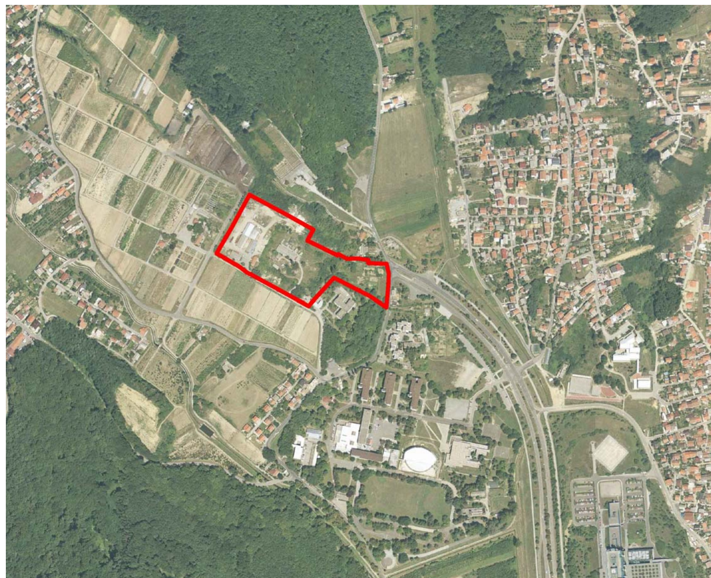
Smještaj obuhvata UPU-a "Šimunska" na digitalnom ortofotu