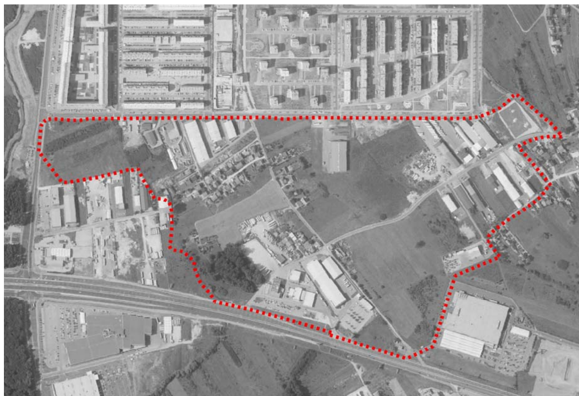
prikaz obuhvata plana na zračnoj snimci