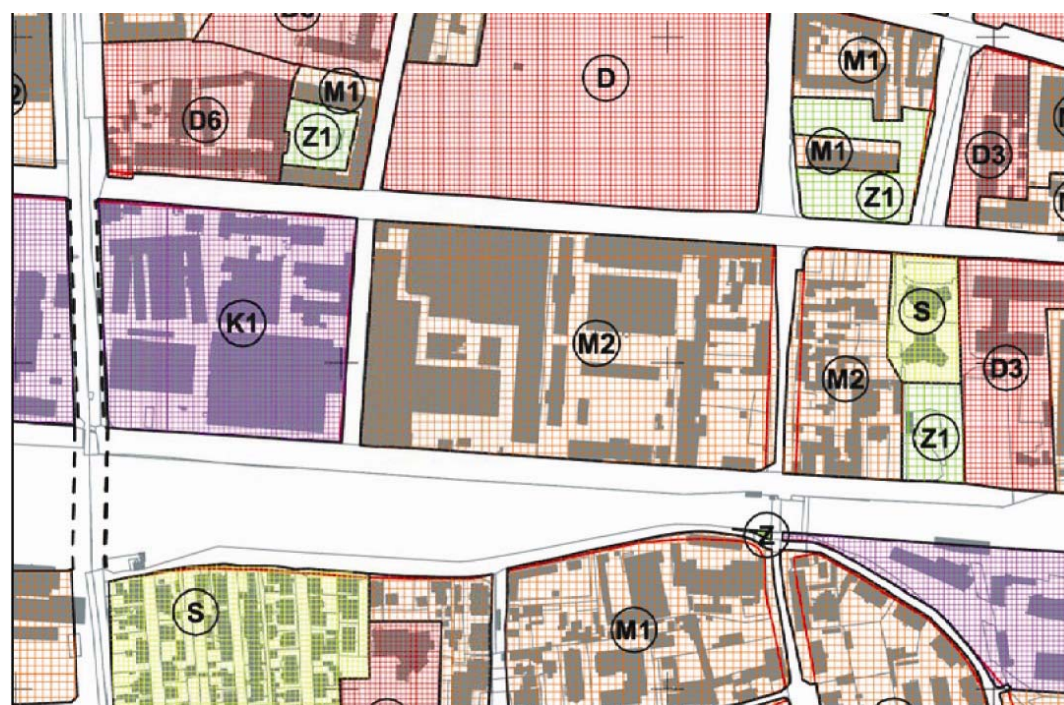
GUP Grada Zagreba (SG GZ 16/07, 02/08, 06/08, 08/08, 10/08, 15/08, 19/08, 08/09 i 11/09)

Kako prihvaćene primjedbe utječu na planska rješenja, prijedlog Izmjena i dopuna Urbanističkog plana uređenja Gradišćanska - Cankarova - Ulica baruna Filipovića upućuje se na ponovnu javnu raspravu.