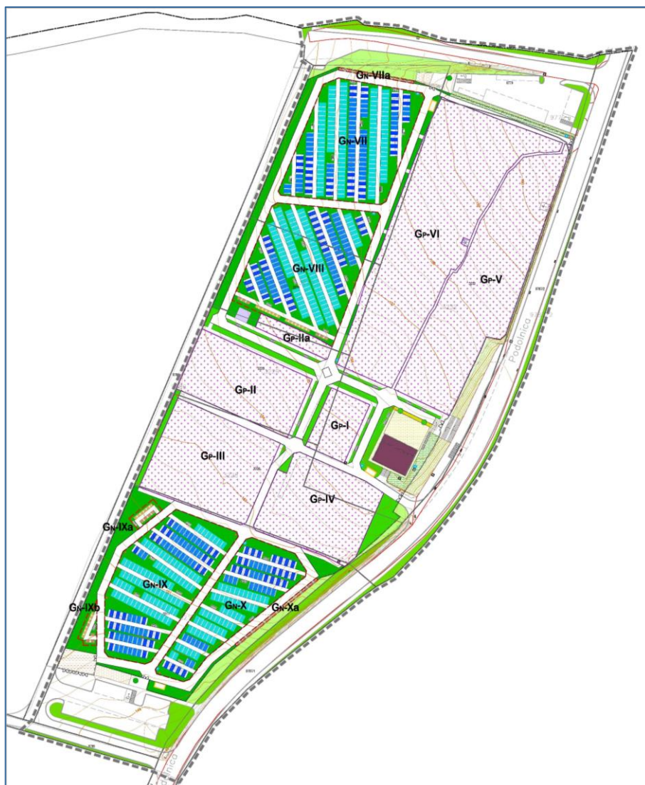
Plan kompleksa groblja

Prostor za građevine pratećih usluga prodaje (prodaja cvijeća, svijeća, opreme i sl.) predviđen je uz nove ulaze s postojećeg sjevernog i novoplaniranog južnog parkirališta u funkciji groblja.