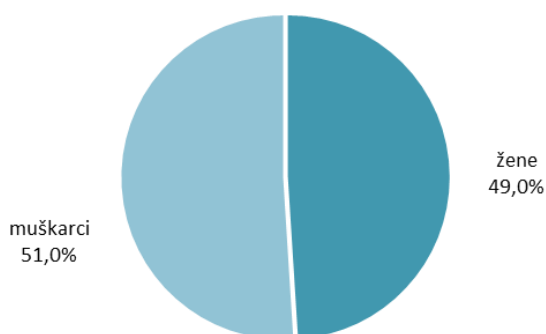
G 1. STRUKTURA ZAPOSLENIH U PRAVNIM OSOBAMA PREMA SPOLU, STANJE 31. OŽUJKA 2017.