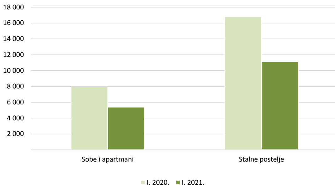
G 3. SMJEŠTAJNI KAPACITETI U SIJEČNJU, 2020. I 2021.

Prosječna popunjenost stalnih postelja u siječnju 2021. iznosila je 12,4%, što je pad od 50,8% u odnosu na siječanj 2020., kada je prosječna popunjenost iznosila 25,2%.