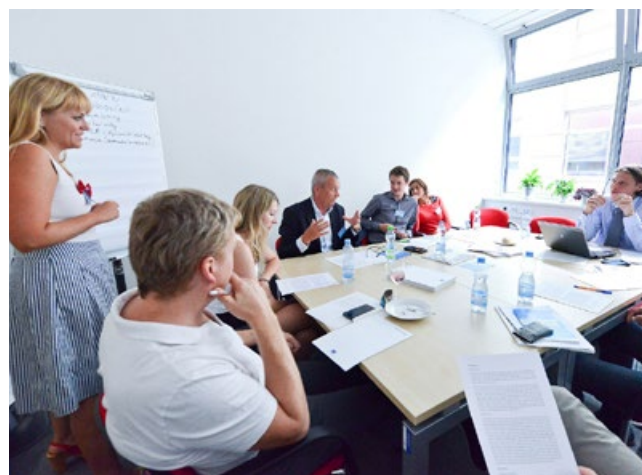
Sastanak o institucionalnoj suradnji u Brnu

Da bi potaknulo sudjelovanje dionika, vodstvo projekta najprije treba pristupiti utvrđenim akterima. To može zahtijevati ulaganje napora radi uvjerljivosti te predstavljanje prednosti koje partnerstvo SUMP-a može donijeti pojedinačnim akterima, ali i gradu i regiji u cjelini. Također je važno zajedno s institucionalnim partnerima osmisliti jasan program kako bi oni znali što se očekuje te koliko kapaciteta može biti potrebno. Konačno, razumijevanje programa partnera ključno je za postizanje dogovora o prioritetima mobilnosti i paketima mjera.