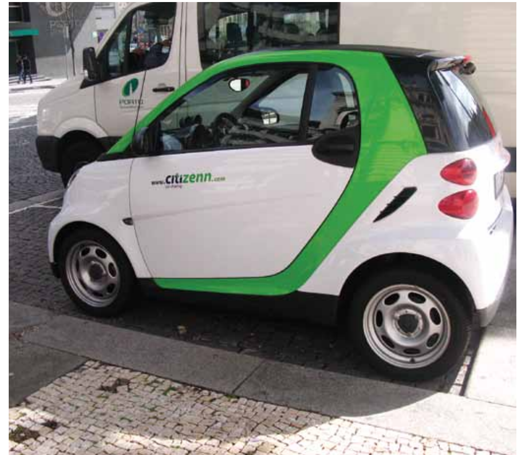
▲ PRIKAZ 05 / IMAGE 05

U četvrtak, posljednjeg dana sastanka u Portu, na