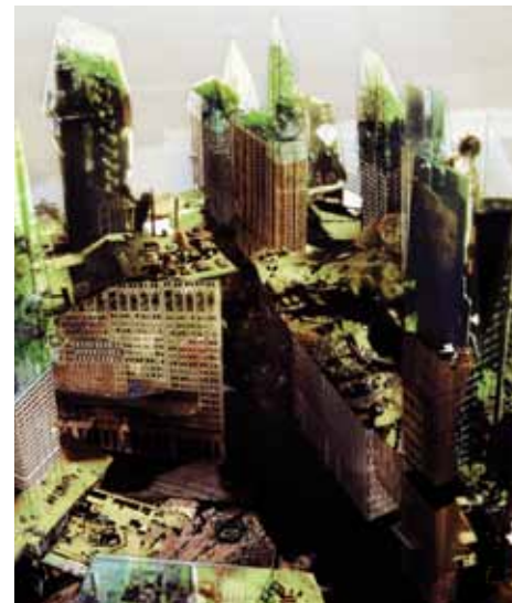
▲ PRIKAZ 21 / IMAGE 21