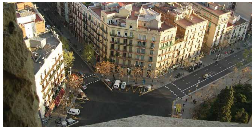
▲ PRIKAZ 13 / IMAGE 13

Na temu pripreme ITS akcijskih planova u Barceloni je, 31. ožujka i 1. travnja 2011., održana godišnja europska konferencija udruženja gradova Impacts ( www.impacts.org ) kojega je Grad Zagreb član od 2006. Na konferenciji je prikazan napredak gradova i zemalja u pripremanju planova i provođenju mjera koje, primjenom informacijskih i komunikacijskih tehnologija na transportne sustave, pridonose sigurnijem, učinkovitijem i održivom transportu. Na Konferenciji je Višnja