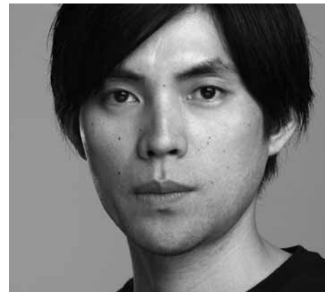
▲ PRIKAZ 23 / IMAGE 23

Četiri natječaja koji će istraživati temu o granicama nastoje proizvesti katalog uvjeta suvremenog života u društvenim, političkim i kulturnim sferama, te za njih katalog arhitektonskih rješenja. Međunarodni žiratori koji će oblikovati natječajne programske zadatke za natjecatelje su: