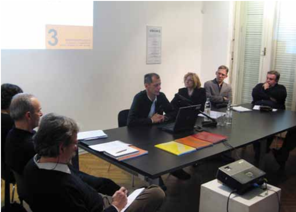
▲ PRIKAZ 03 / IMAGE 03