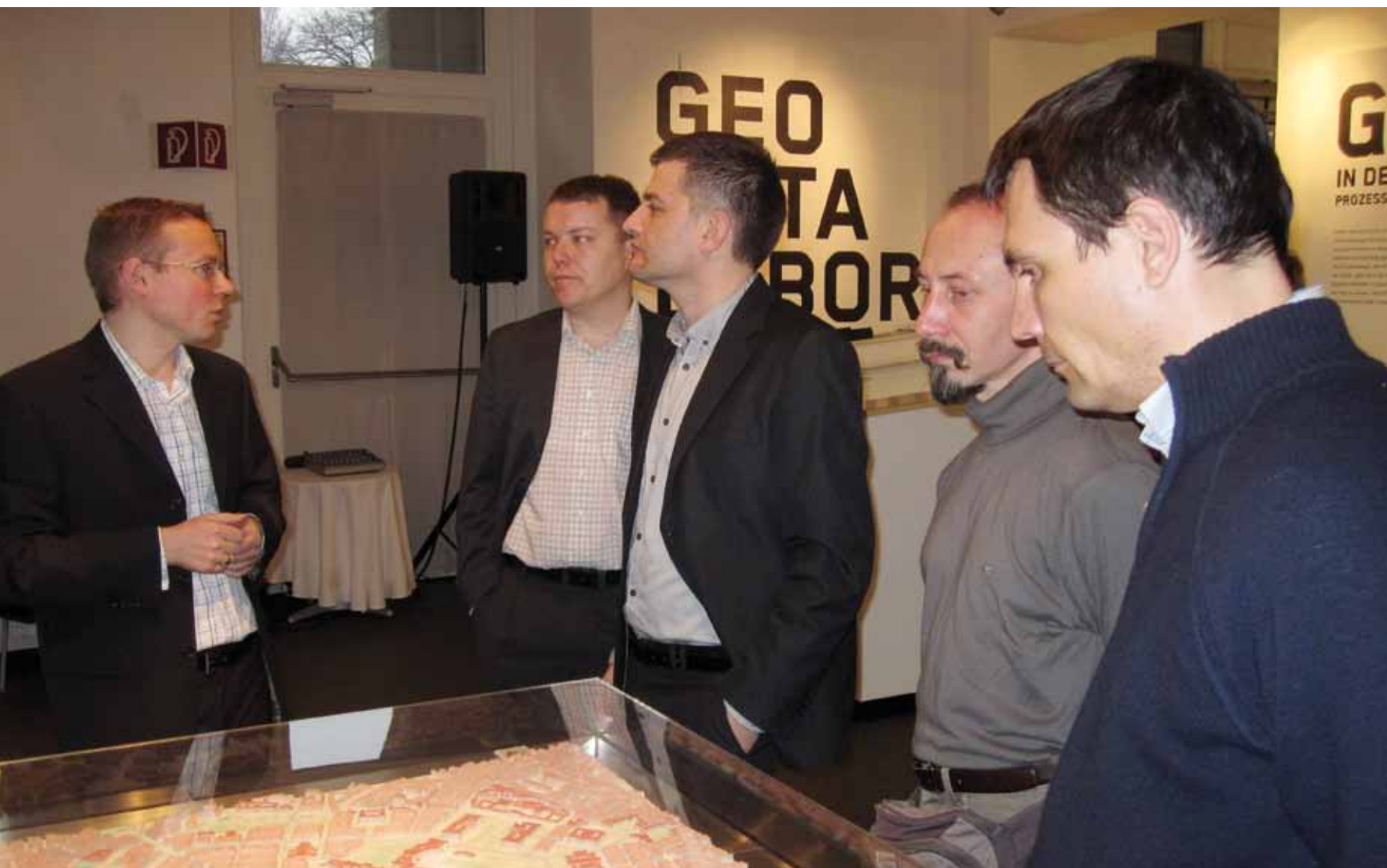
▲ PRIKAZ 01 / IMAGE 01