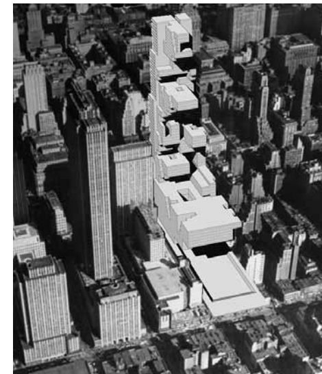
▲ PRIKAZ 22 / IMAGE 22

Konceptualno najradikalniji No gravity, no ground , tajvanskih autora Maoa i Yanga, oslanja se na NASA-ina tehnološka dostignuća koja relativiziraju gravitaciju,