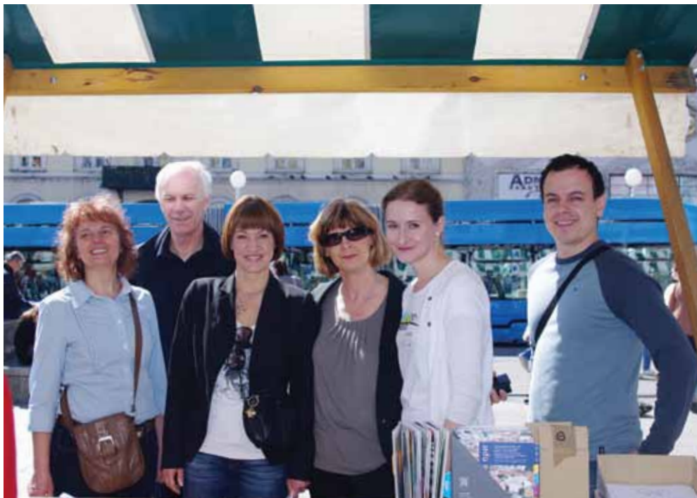
▲ PRIKAZ 15 / IMAGE 15