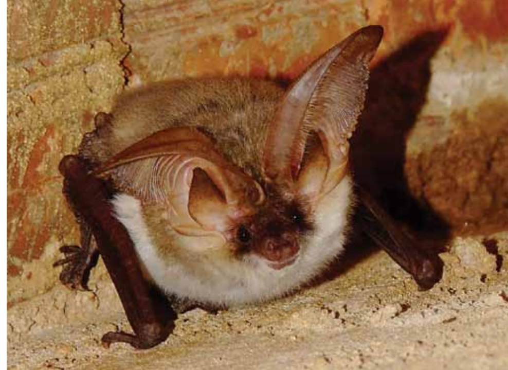
▲ PRIKAZ 25 | SMEĐI DUGOUŠAN / IMAGE 25 | BROWN LONG-EARED BAT

A census is a statistical study conducted every 10 years to collect data on number, territorial distribution and structure of population, and data on households and dwellings, based on different demographic and socio-economic characteristics. The 2011 Census of Croatia is carried out from 1 to 28 April. Data collected by the Census in aggregated form are used for statistical purposes only. Confidentiality is regulated by the Census Act and Official Statistics Act.