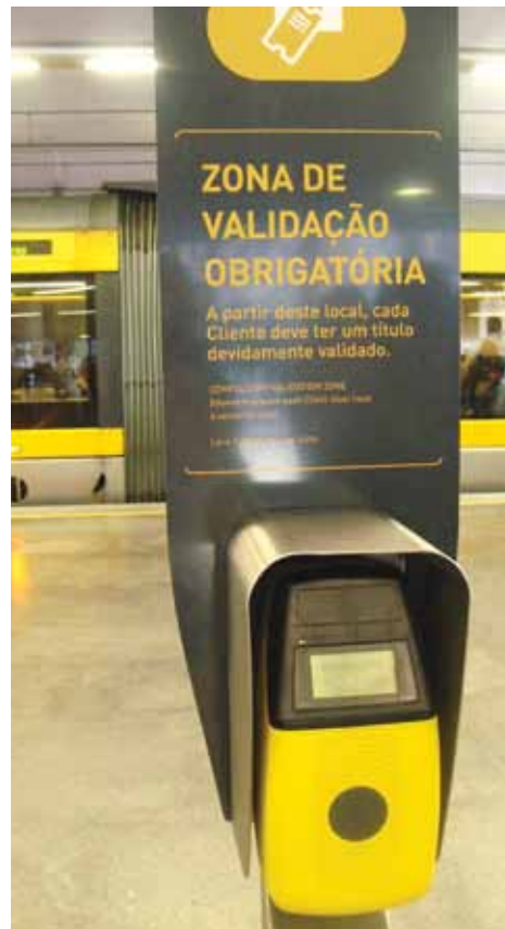
▲ PRIKAZ 04 / IMAGE 04

Posjet Portu iskorišten je i za upoznavanje svih sudionika s provedbom mjera projekta Civitas Elan u tom gradu. Porto, grad zanimljive topografije i specifičnih transportnih problema, prikazao je posjetiteljima Mobility Shop-a mjesto u kojem se, davanjem niza informacija o prednostima javnoga gradskog prijevoza, potencijalnim korisnicima nastoji približiti sustav i potaknuti ih na što rjeđe korištenje automobila i korištenje održivih sustava mobilnosti. Osim Mobility Shopa sudionici su posjetili Medicinski fakultet u Portu i pripadajuće klinike te su imali priliku vidjeti kako funkcionira sustav koji korisnicima pomaže da, na temelju preciznih podataka, planiraju svoja putovanja javnim gradskim prijevozom.