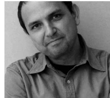
▲ PRIKAZ 24 / IMAGE 24