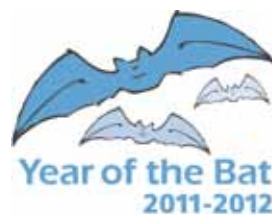
▲ PRIKAZ 26 / IMAGE 26

Their prominent ears make the long-eared bats the most likable bat among those living within the City of Zagreb territory. Unlike other bats they are relatively slow flyers, their ultrasonic echo signal for prey location is hardly audible and its range is short. We do not know where the long-eared bats nest in the City of Zagreb territory. Therefore no one knows their number, very little can be done for their active protection, and their population cannot be monitored. So, if you happen to see them, please notify the Croatian Natural History Museum or the State Institute for Nature Protection.