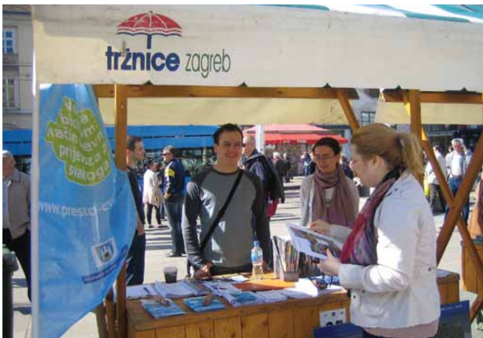
▲ PRIKAZ 14 / IMAGE 14