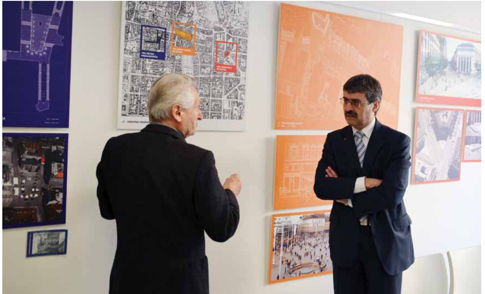
▲ PRIKAZ 07 / IMAGE 07

The delegation of the City of Bratislava, led by the Mayor, Mr Milan Ftačnik and the main city