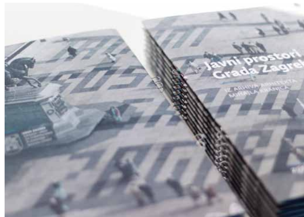
▲ PRIKAZ 18 / IMAGE 18

The mayor of the City of Zagreb opened the exhibition Public Spaces in Zagreb from the Archives of Architect Mihailo Kranjc at ZgForum on March 19 at 7 PM. Kranjc began his work on Zagreb public spaces in the late seventies, designing and building many squares and public spaces in Zagreb in the next two decades, along with sculpture displays.