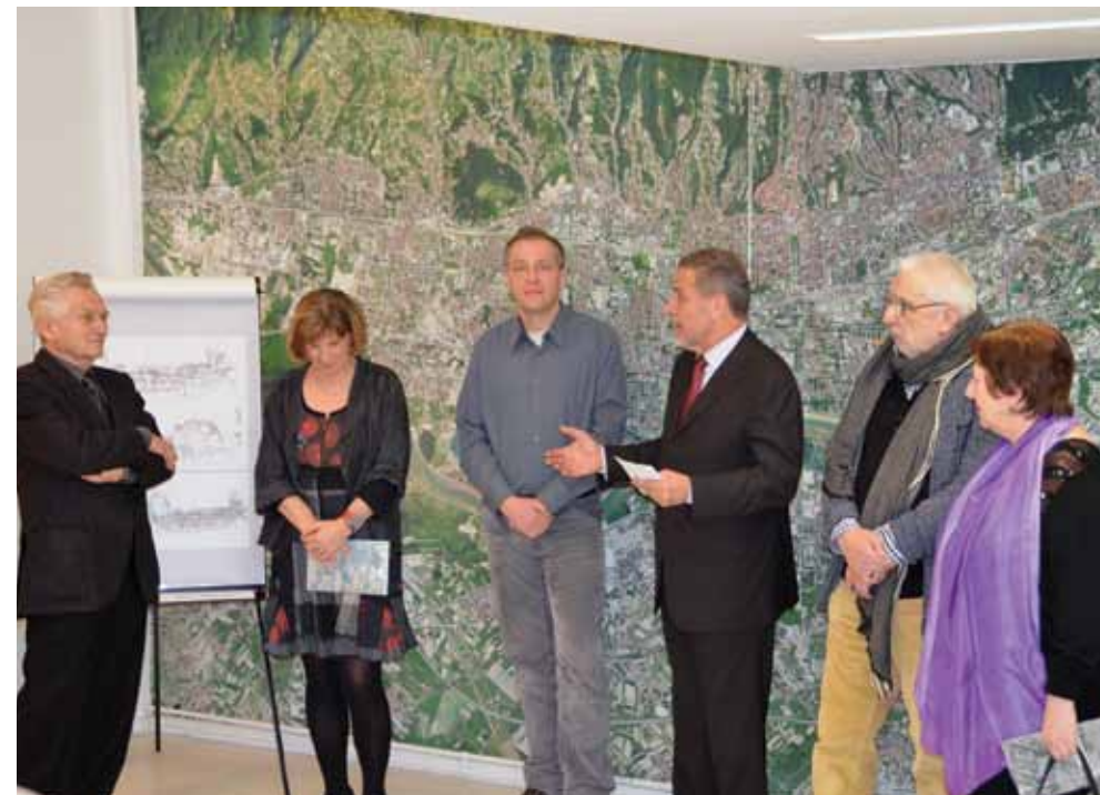
▲ PRIKAZ 19 / IMAGE 19