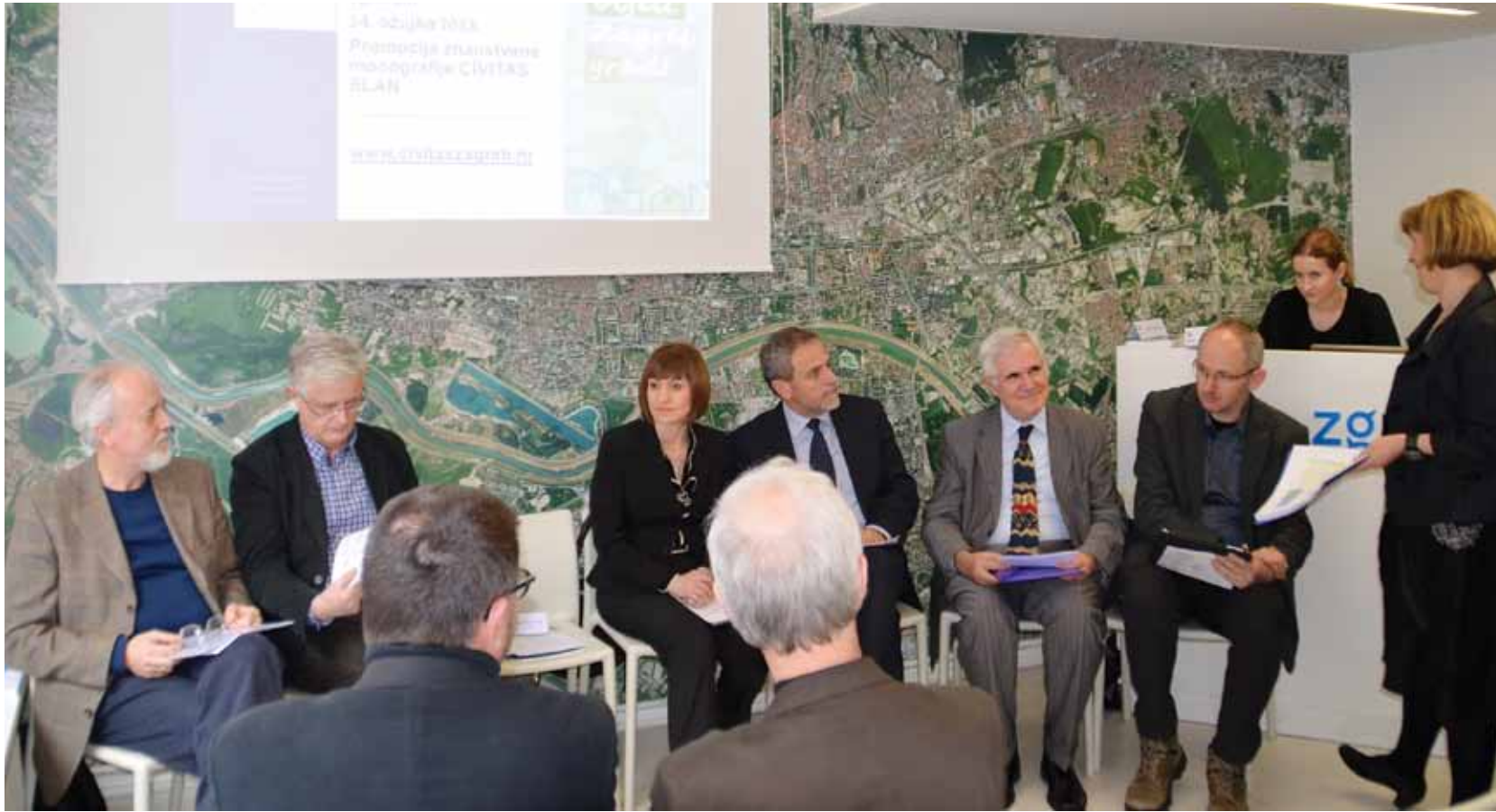
◀ PRIKAZ 06 / IMAGE 06

U projektu su uspješno povezani brojni znanstvenici iz tehničkih i društvenih znanosti s akterima koji se u gradskim uredima, stručnim službama te organizacijama civilnog društva bave problematikom održivih politika u gradskom prometu. Ta odlika umrežavanja, koja nadilazi česte prepreke u interdisciplinarnim i transdisciplinarnim pokušajima suočavanja s društvenim izazovima, jedna je od glavnih značajki projekta u cjelini i dodatna kvaliteta same monografije.