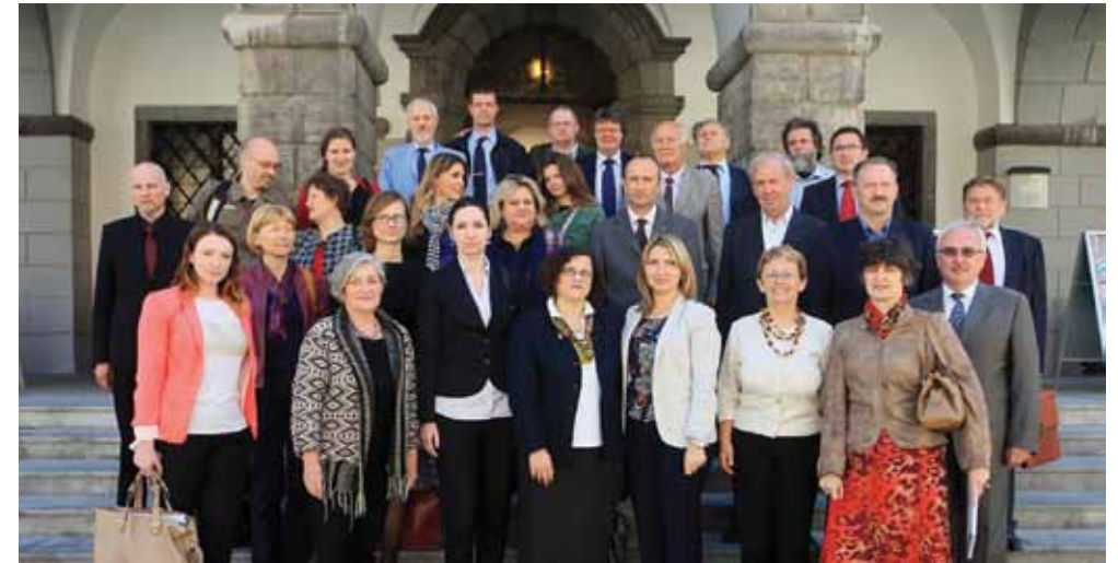
▲ PRIKAZ 12 / IMAGE 12

The seventh regular meeting of the consortium of the project Trailblazer was held in Prague on April 24 and 25, 2013. The workshop was attended by the partners of the project, its core team as well as its user group which was represented by a number of experts in the fields of logistics from various institutions of both the private and the public sectors across Europe.