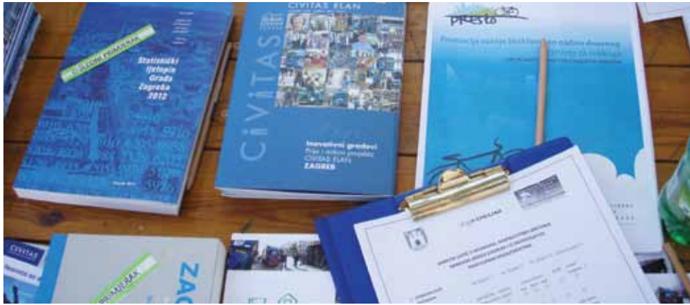
▲ PRIKAZ 13 / IMAGE 13