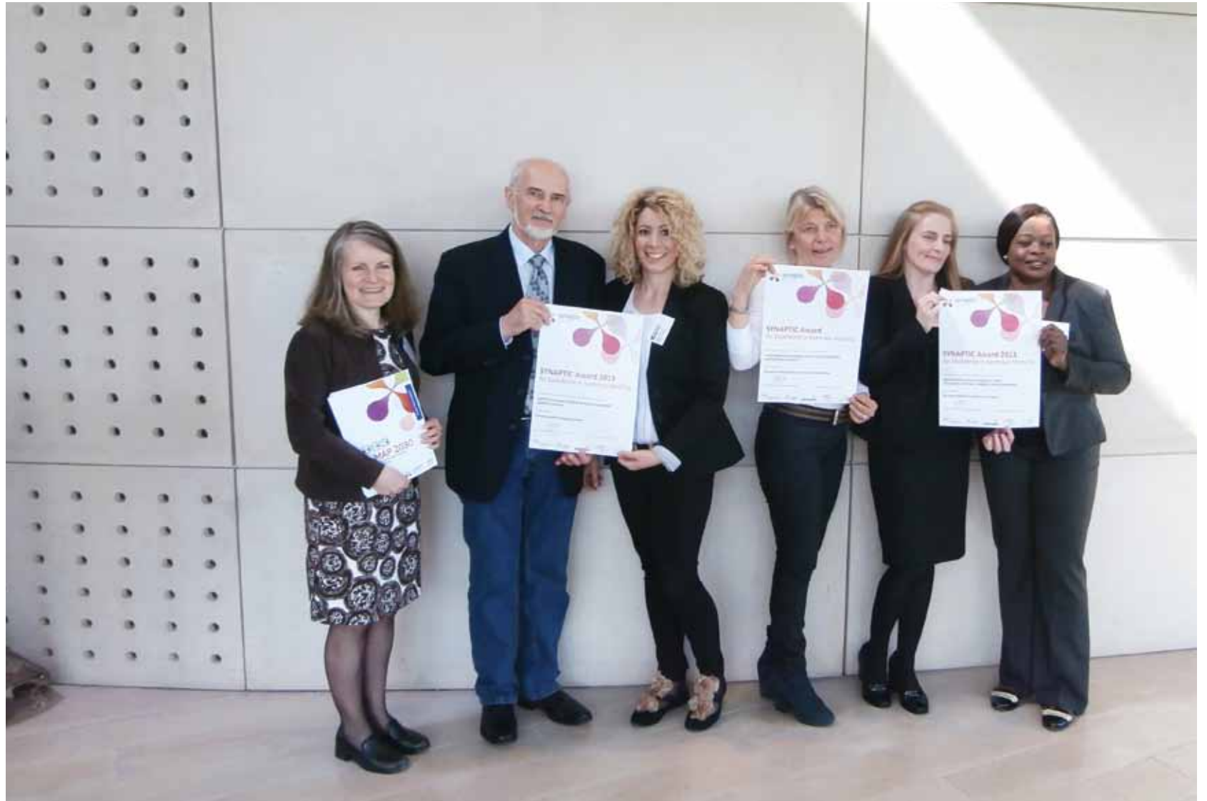
▲ PRIKAZ 08 / IMAGE 08

Projekt CIVITAS Elan proveden je od 2008. do 2012., a sudjelovali su sljedeći gradovi: Ljubljana (Slovenija), Gent (Belgija), Porto (Portugal), Brno