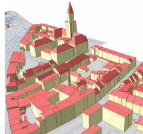
▲ PRIKAZ 03, PRIMJER LOD 2 / IMAGE 03

Rezultati ankete pokazuju veliku potencijalnu primjenjivost podataka 3D modela u upravljanju gradom, detektiran je LoD 2 kao odgovarajući stupanj detaljnosti modela za većinu primjena, prioriteta za izradu urbano je područje Zagreba i Sesveta te zone gradskih projekata, većinom je zadovoljavajuća jednogodišnja ažurnost, a korisnici imaju