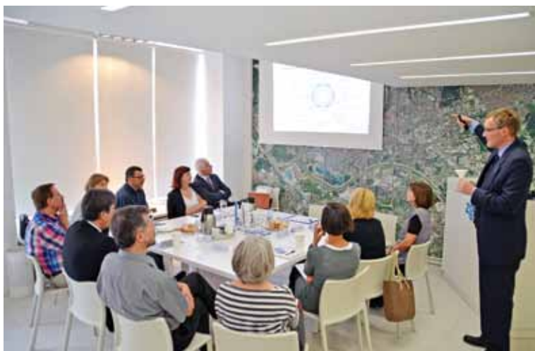
▲ PRIKAZ 24 / IMAGE 24