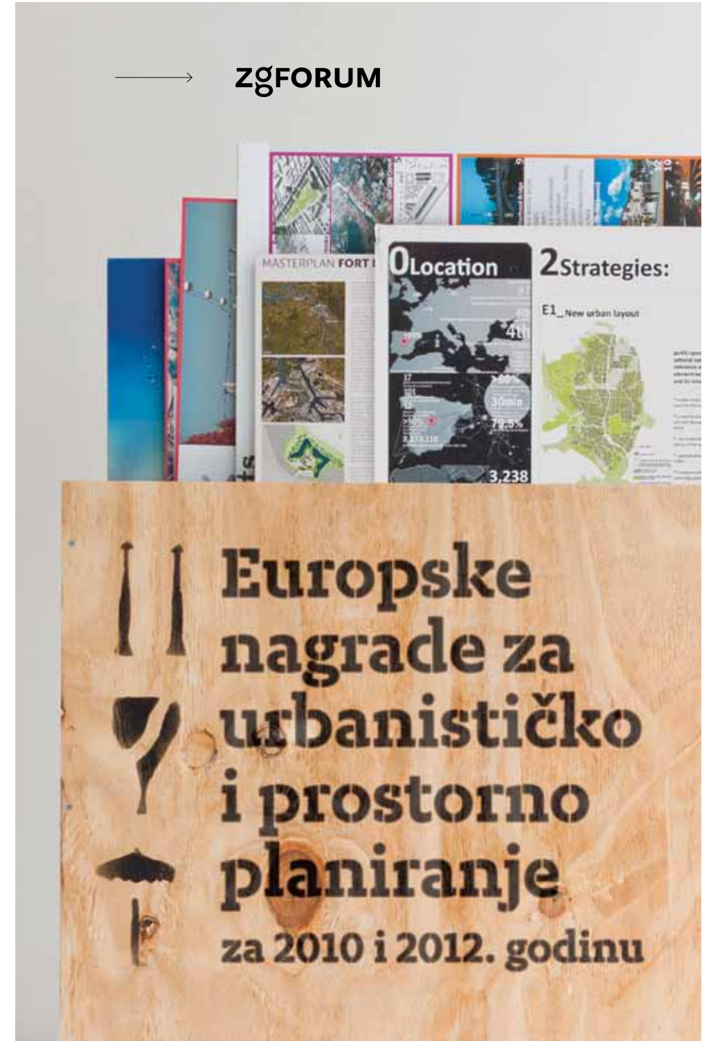
▲ PRIKAZ 27 / IMAGE 27

The Association of Croatian Planners (UHU) in the cooperation with the City Office of Strategic Planning and Development, organized the exhibition of planning projects from the member countries of the European Council of Spatial Planners - Conseil européen des urbanistes (ECTP-CEU) from 2010 and 2012. The City of Zagreb competed in 2010 with subsidised housing project Špansko-Oranice.