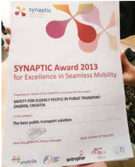
▲ PRIKAZ 07 / IMAGE 07