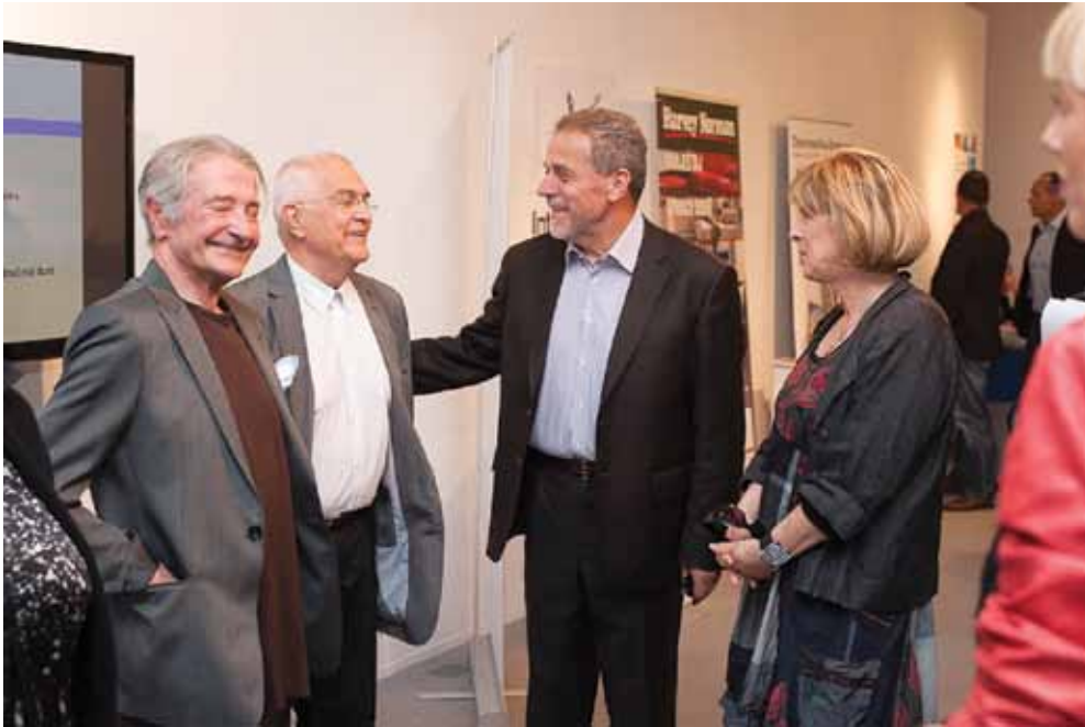
▲ PRIKAZ 17 / IMAGE 17