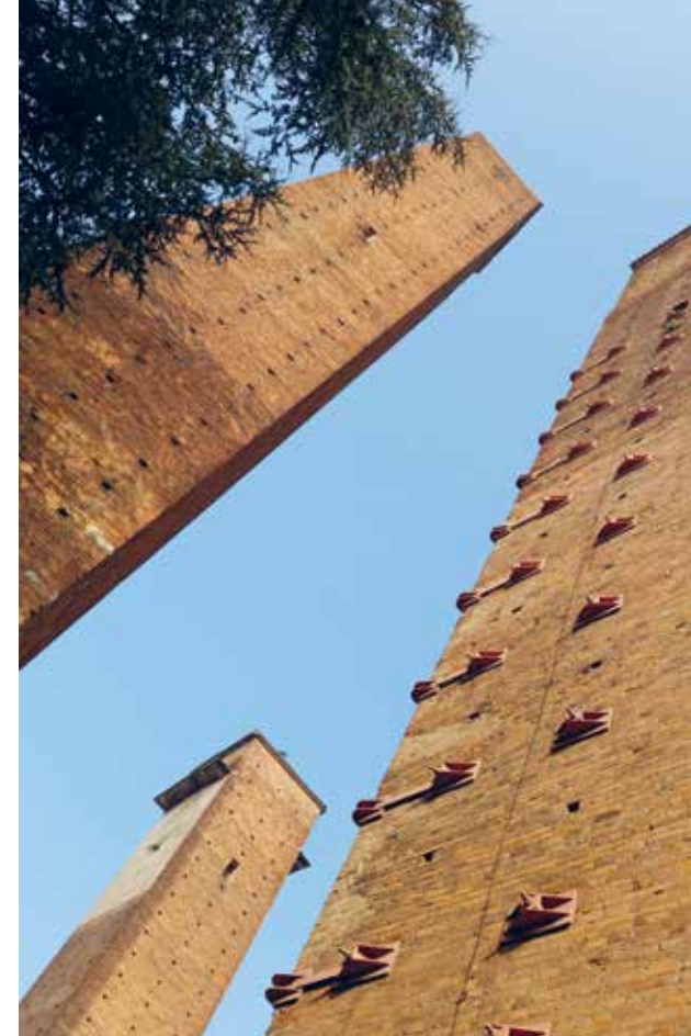
▲ SLIKA 06 | IMAGE 06

Zagreb na 13. Europlanu sudjeluje s lokacijom koju čine četiri odvojena neuređena gradska