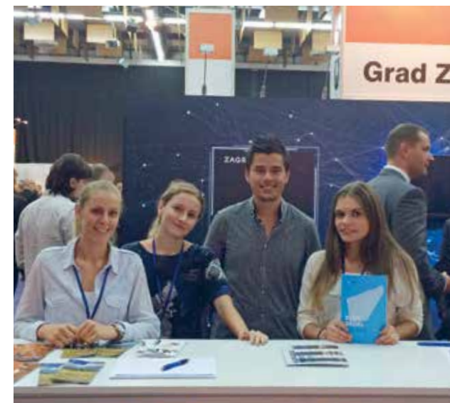
▲ SLIKA 12 | IMAGE 12