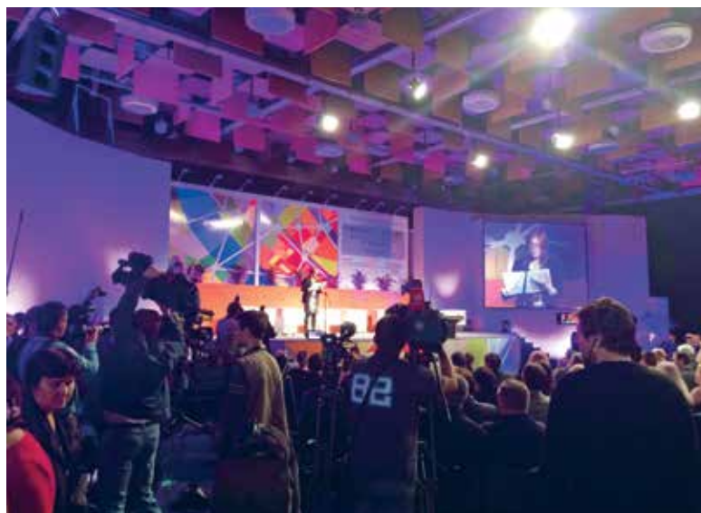
▲ SLIKA 11 | IMAGE 11

At the beginning of September, the City Office of Strategic Planning and Development of the City started a series of trainings financed by the Ministry of Regional Development and EU Funds under Subprogramme 5 'Strengthening Human Resources at Local and Regional Levels for Efficient Preparation and Use of EU Funds'. The trainings are conducted by external educators and employees of the City Office of Strategic Planning and Development of the City and will take place until mid November.