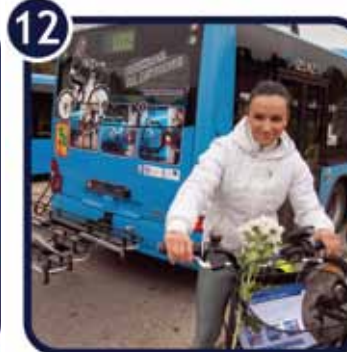
12. Nakon silaska s autobusa nastavite vožnju