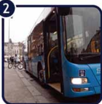
2. Naznačite vozaču da ćete staviti bicikl na nosač