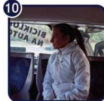
10. Prilikom izlaska iz autobusa najavite vozaču da ćete uzeti bicikl