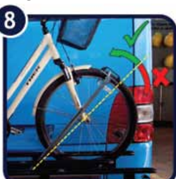
8. Namjestite ga na gornjem dijelu prednje gume