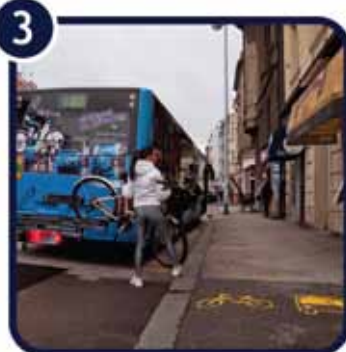
3. Podignite zadnji kotač na nosač bicikala