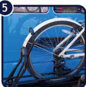
5. Zadnji držač nosača osigurat će stabilnost