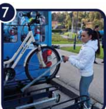
7. Povucite prednji držač preko osovine kotača