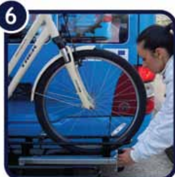
6. Povucite ručku prednjeg držača prema sebi