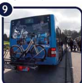
9. Uđite na prva vrata

„Biciklom na autobus“ je pilot projekt unutar kojeg je moguć prijevoz bicikala autobusom na linijama 102,103 i 140 na području grada Zagreba.