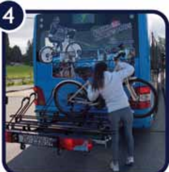
4. Gurnite bicikl unutar nosača