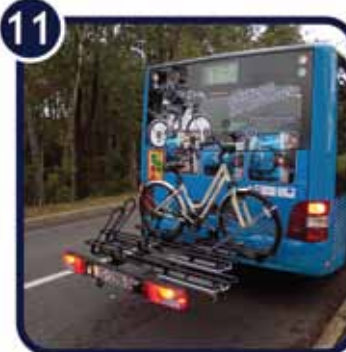
11. Autobus u vožnji sa biciklom