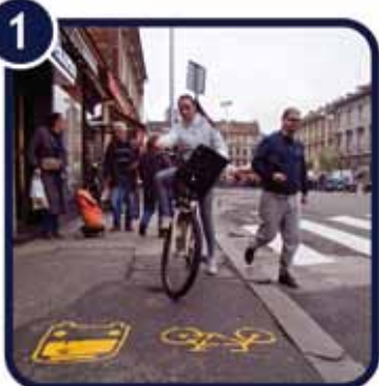
1. Na označenom stajalištu čekajte autobus